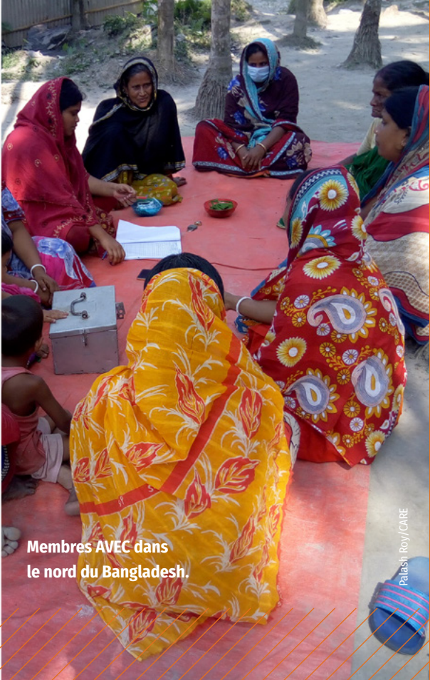
Membres AVEC dans le nord du Bangladesh.

Lors du Forum Génération Égalité , nous nous sommes engagés à nous associer à au moins 10 pays africains pour former et intégrer des AVEC dans leurs cadres politiques nationaux. Nous avons commencé à inciter les gouvernements du Rwanda, de la Côte d'Ivoire, du Nigéria, du Malawi, de la Tanzanie, du Niger, du Mali et du Kenya à s'engager formellement à utiliser les AVEC comme points d'entrée dans leurs politiques et programmes de protection sociale et de graduation. Au cours de l'année à venir, nous poursuivrons notre cartographie complète des politiques et notre analyse du paysage de ces pays, afin de déterminer les meilleurs points d'entrée pour le plaidoyer, l'accompagnement et le soutien technique par CARE et les principales parties prenantes.