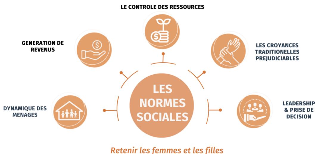
Figure 1: Les types de normes sociales affectant les femmes et les filles au Bangladesh, en Ethiopie, au Malawi et en Ouganda.

Chaque communauté et société est façonnée par des normes spécifiques qui définissent ce qui est attendu et cru d'elle. S'écarter de ces croyances ou attentes peuvent entraîner des conséquences négatives pour les femmes et les filles. L'expérience des programmes de CARE met en évidence la manière dont les individus sont confrontés à des obstacles touchant de nombreux aspects de leurs vies, de leur capacité à prendre des décisions au sein de leurs familles et communautés à leur autonomie sur leur propre corps.